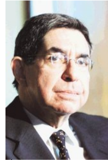
OSCAR ARIAS. “El corruptor sabe a quién puede corromper”.

“Nadie me ha ofrecido un soborno o una comisión en mi vida, ni cuando fui ministro ni cuando fui diputado, ni de presidente. Creo que el corruptor sabe a quién puede corromper. Me siento orgulloso de que nadie siquiera se atreviera a ofrecerme un soborno en más de la mitad de mi vida al servicio público”.