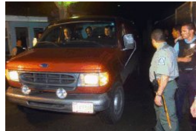
NUEVA UBICACIÓN. Alas 5:45 p. m. los portones del centro penitenciario La Reformase abrieron para dar paso al vehículo en el que viajaba el expresidente Miguel Ángel Rodríguez. Un contingente de policías antimotines se mantuvo cerca para prevenirla reacción de la gente.