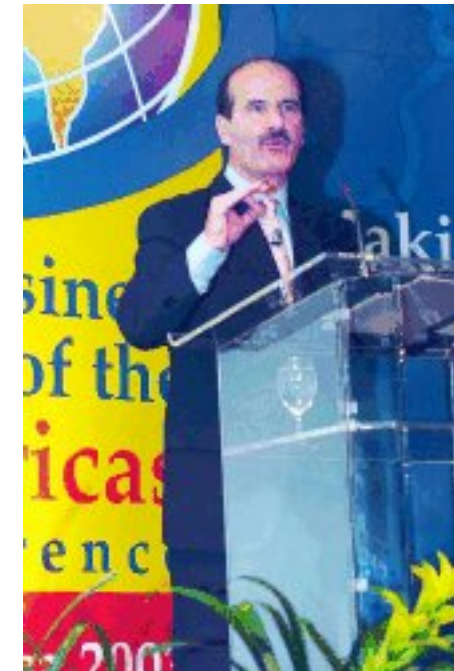
LEGAL. Figueres insistió en que su renuncia no tiene nada que ver con las “acusaciones infundadas” que se le hacen en Costa Rica.