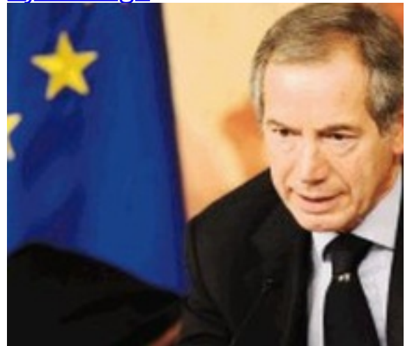
Asesor de Berlusconi causa escándalo en Italiaayer