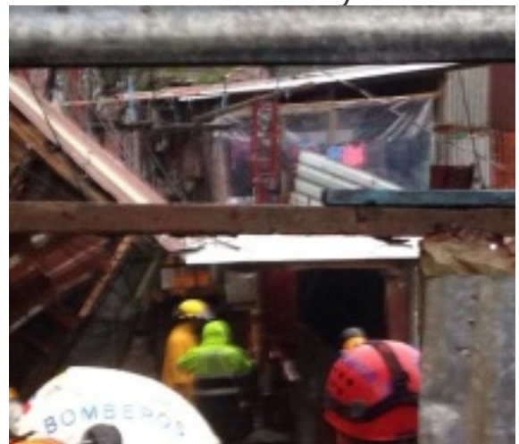
50 personas tuvieron que dejar sus casas por deslizamiento en Curridabatayer