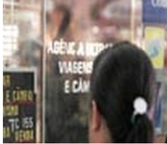
Brasil reta a Latinoaméricaayer