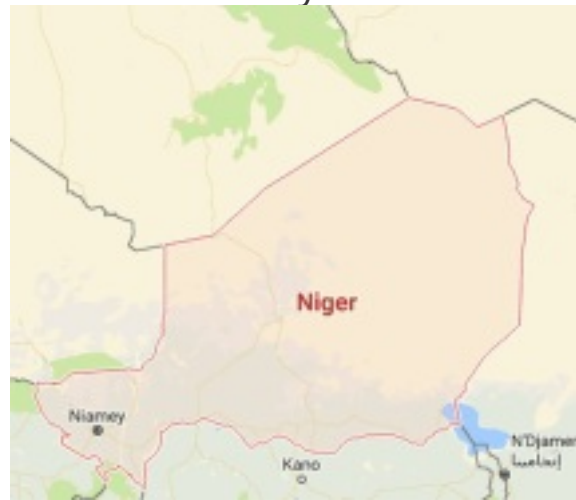
Secuestrado trabajador humanitario estadounidense en Nígerayer