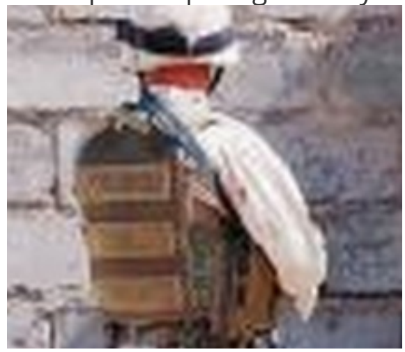
No había pruebas de armas en Iraqayer