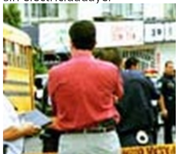
Piden prisión para guardaayer