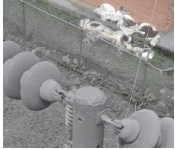
Vecinos de La Pastora y La Central de Turrialba siguen sin electricidadayer